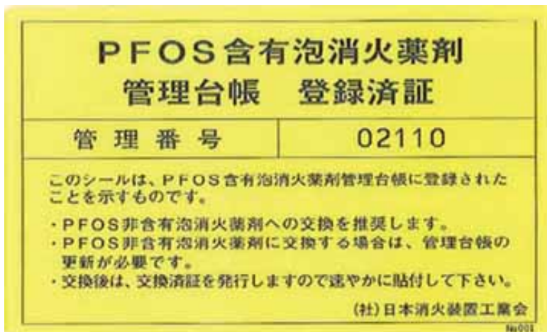
図1. PFOS含有泡消火薬剤 管理台帳 登録済証 (黄色地に黒文字)

各シールは、ご注文を頂いてからお手元に届くまで時間を要しますので、予め見込み数量をご購入いただく事をお勧めします。