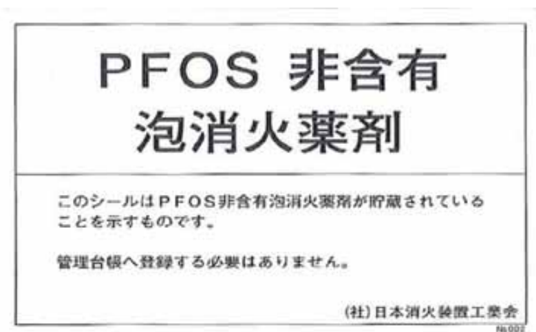
図2. PFOS非含有泡消火薬剤シール (白色地に黒文字)