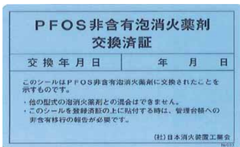
図5. PFOS含有泡消火薬剤交換済証（水色地に黒文字）